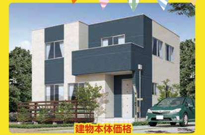
建物本体価格 施工面積 37坪・2階建 1,356万円