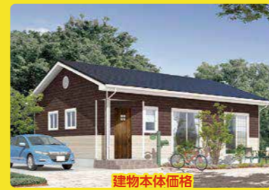
建物本体価格 施工面積 25坪・1階建 1,065万円