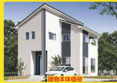
建物本体価格 施工面積 25坪・2階建 877万円