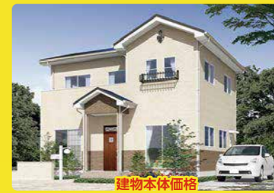
建物本体価格 施工面積 30坪・2階建 1,065万円